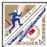
Obr. 23 Trojúhelníková zn. s kuponem (Mi 3193).

23) vygláží tiskový list znovu dohru jako protichůdně dvojice takových známek. Je to počet kuponů v tiskovém listu početná část, takže známka s kuponem je dohru vytištěna, například v sérii známek 1967-1968 na obr. 28 (MR 5/2012).