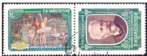
Obr. 19 Soutisk zn. „Čajkovskij“ – otočení pravé známky o 90°

Poměrně málo se vyskytuje známkový soutisk, v němž je jedna známka otočena o 90°, tzv. soutisk (obr. 19).