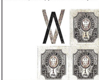
Obr. 21 Dvojbarevný potisk rohového kuponu

listů 1. vydání výplatních známek RSFSR „Symboly práce“ vytištěny dělničtími známky „Na pomoc obytelnému Petrodru“ (obr. 20). Pracovníci Gosplaku (Státní tiskárny cenů) je vytiskli ve svém vlastní čase a bez nároku na mezd. Občanské je převést a kataloží (2).